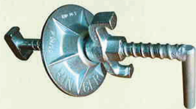
RS-SPANNKLEMME Art.Nr. 704 5 Gewicht: 1,85 kg