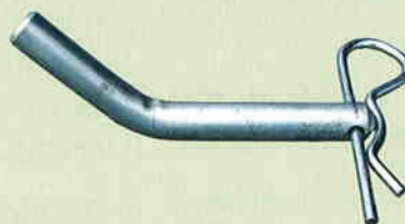
VERBINDUNGSBOLZEN MIT FEDERVORSTEHER Art.Nr. 409 14 Gewicht: 0,5 kg