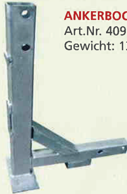
ANKERBOCK Art.Nr. 409 11 Gewicht: 13,9 kg