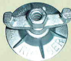
KOMBIPLATTE Art.Nr. 407 77 Gewicht: 1,1 kg