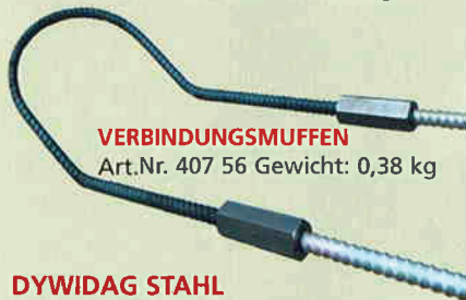
VERBINDUNGSMUFFEN Art.Nr. 407 56 Gewicht: 0,38 kg