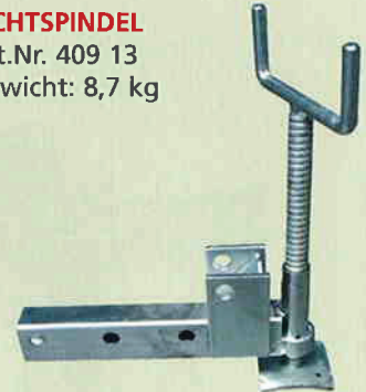
RICHTSPINDEL Art.Nr. 409 13 Gewicht: 8,7 kg